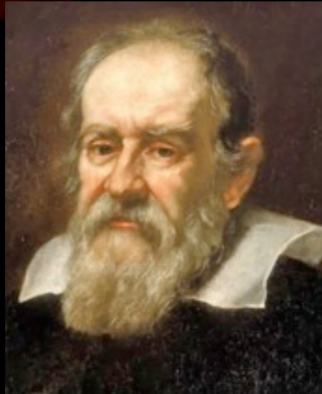
ガリレオ・ガリレイ