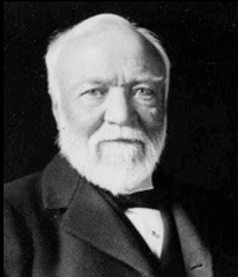
アンドリュー・カーネギー